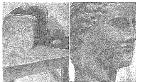
高校生支援事業の中で、塾代の支援を受けながら、美術大学を目指す学生作品。

思春期にも入り、いじめや不登校などの問題も出てきます。そこで、本事業では子どもたちのコミュニケーション力をつけることによって、学校に通うことが楽しくなり、学習意欲が高まることをめざし、NPO法人JAMネットワークと連携しながら、毎年5～7施設において、子どもたち向けのワークショップ(以下、「ことばキャンプ」)を全6回開催しています。毎回、数名の職員も参加しながら、ワークショップの運営をサポートするとともに、コミュニケーション力の育て方を学んでいます。また、「ことばキャンプ」の実施前後には、全職員を対象とした研修を3回実施しており、本事業の意義や方法論を施設全体で共有できるようにしています。 最初は全く自分の意見を言えなかった